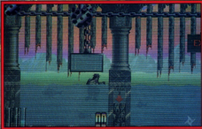
Amiga Screen Shots.

Maletoth remains a deadly threat: only when he's been utterly destroyed will you be wholly free from his malignant influence. In puny human form you now face the many testing challenges and powerful foes that stand between you and your final encounter with the Beast Lord.